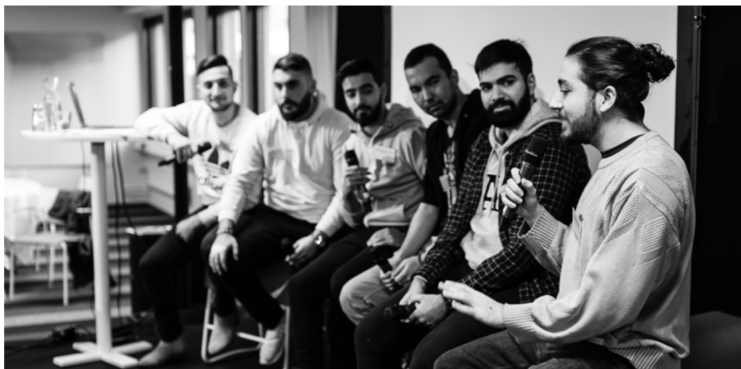
Representanter från Heroes, Shanazi och Sharaf hjältar berättar om sitt engagemang.