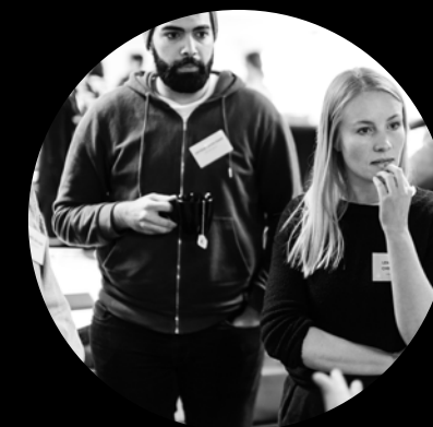
Representanter från tyska organisationen Heroes.

Under åren har Integrate UK mött motstånd på olika sätt, särskilt från konservativa äldre män. Förra året tog det ny skruv när organisationen drev kampanjen #MyClitoris mot kvinnlig könsstämpning. De skapade uppståndelse med en kampanjlåt som fastnar direkt och bärs fram av en knallrosa musikvideo.